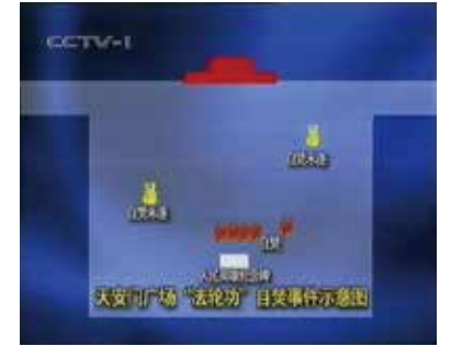
圈套的自焚位置图