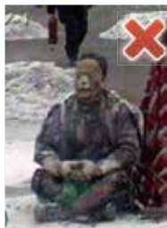
盘腿动作完全不同