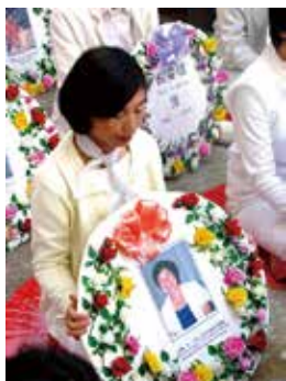
海外悼念被迫害致死的大陆法轮功学员。