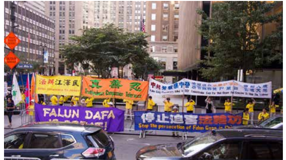
2016 年 9 月 18 日纽约，在中国总理李克强参加第 71 届联合国大会期间，法轮功学员在联合国大厦和华尔道夫酒店对面展开“法办江泽民”等中英文横幅。

中国大陆法轮功学员控告江泽民的义举，得到了国际社会的响应与声援。从 2015 年 7 月到 2018 年 4 月，全球已有 32 个国家及地区、逾 278 万人参与刑事举报江泽民的连署行动。