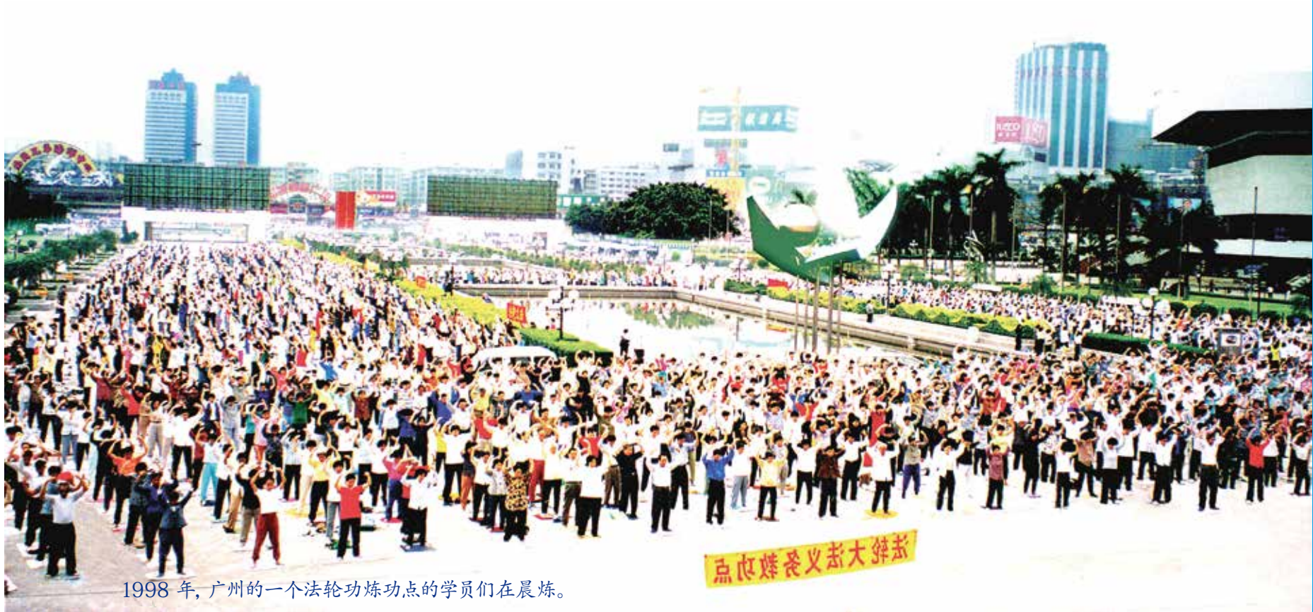
1998年，广州的一个法轮功炼功点的学员们在晨炼。

据当时中国公安内部调查，从1992年5月至1999年7月的7年间，中国大陆炼法轮功的人数达到7000万至1亿，超过共产党员的人数。法轮功在极短时间内的迅速传播，使“假恶斗”的中共和对权力极端偏执却又贪腐无能的江泽民本能地产生嫉妒和恐惧。