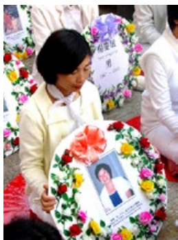
海外悼念被迫害致死的大陆法轮功学员。