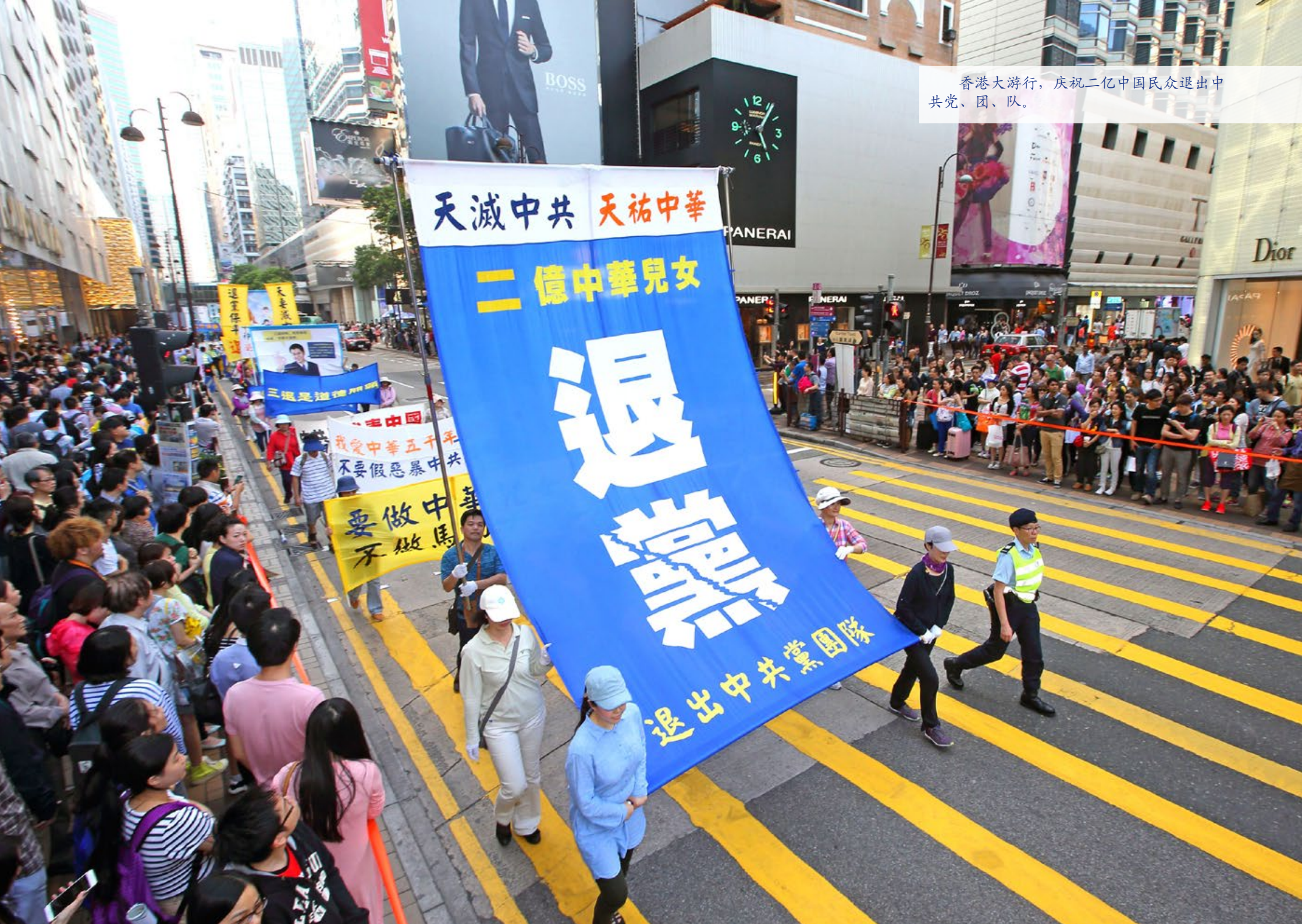
香港大游行，庆祝二亿中国民众退出中共党、团、队。