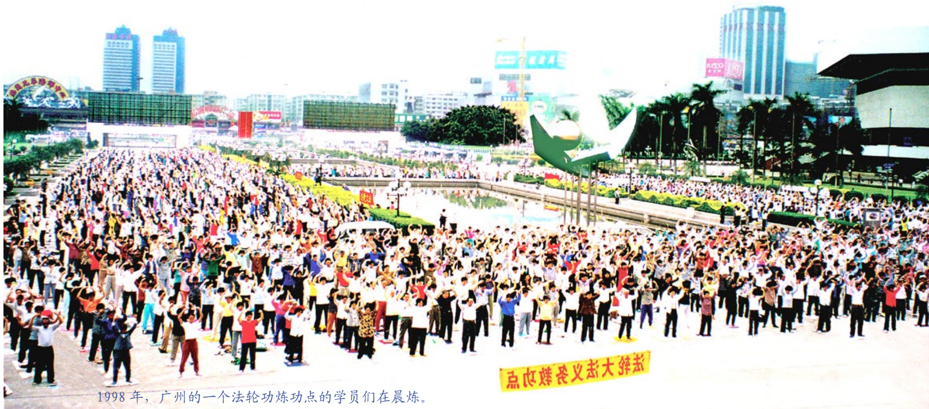
1998年，广州的一个法轮功炼功点的学员们在晨炼。

据当时中国公安内部调查，从1992年5月至1999年7月的7年间，中国大陆炼法轮功的人数达到7千万至1亿，超过共产党员的人数。法轮功在极短时间内的迅速传播，使“假恶斗”的中共和对权力极端偏执却又贪腐无能的江泽民本能地产生嫉妒和恐惧。