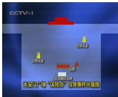
圈套的自焚位置图

那些误会法轮功学员会杀生、自杀的朋友不妨看一下李洪志先生这两段讲法，李先生明确要求他的弟子：