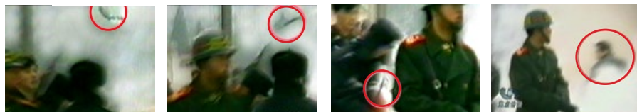
警察盯着凶器落下，摄像机左移