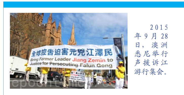
2015年9月28日，澳洲悉尼举行声援诉江游行集会。

迫害善良群体遇到了空前的阻力，为炮制迫害借口，“天安门自焚”伪案被江泽民集团导演了出来。