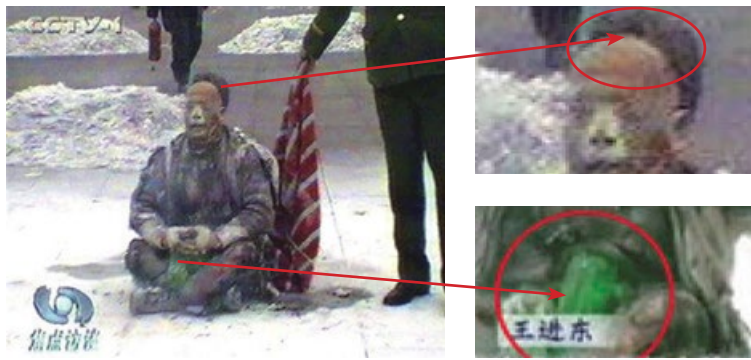
警察晃着灭火毯等镜头 火烧后塑料瓶完好翠绿

■ 穿帮之一： 开水一烫就变形的塑料瓶，竟在大火之后不变形，棉衣和裤子烧烂烧黑，它却依旧翠绿！