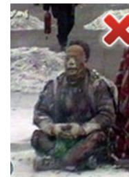
盘腿动作完全不同